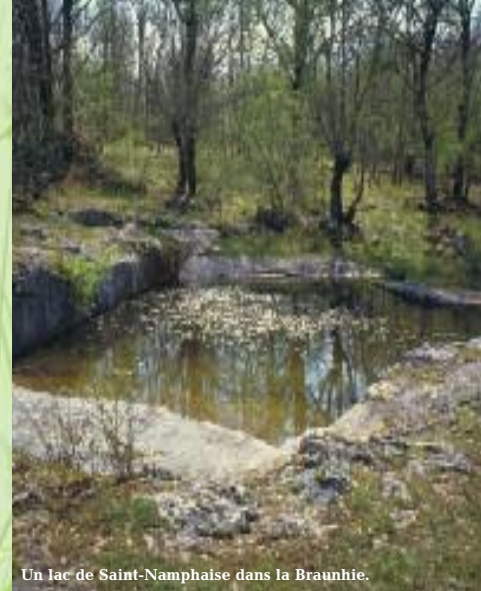
Un lac de Saint-Namphaise dans la Braunhie.

Espace Naturel Sensible (E.N.S.) - Voir p. 62