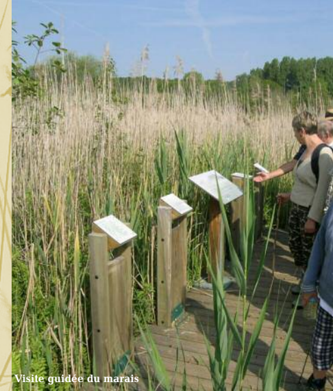
Visite guidée du marais

Peut-on imaginer un marais de 42 hectares à la limite du Causse de Gramat ? Et pourtant c'est le cas à Bonnefont. Ce bas marais alcalin à caractère tourbeux est très rare dans le département et notamment sur le territoire du Parc naturel régional ; il possède la plus grande roselière (lieu où poussent les roseaux) du Lot. Les eaux jaillissent des résurgences, circulent dans le marais et forment, avec celles de la fontaine de Bonnefont et du petit marais de Lentour, le ruisseau de l'Alzou qui coule à Rocamadour, puis rejoint l'Ouyse avant de se jeter dans la Dordogne. Cet espace d'un grand intérêt écologique est préservé et aménagé pour accueillir le public. Sa gestion est assurée par la Communauté de Communes du Pays de Padirac.