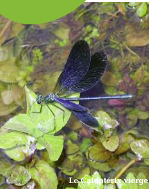
Le Caloptéryx vierge

Le marais de Bonnefont est sillonné par un enrichissant sentier de découverte. Cet itinéraire d'interprétation en 8 "étapes" ludiques et pédagogiques permet de mieux comprendre et d'apprécier cet exceptionnel milieu naturel.