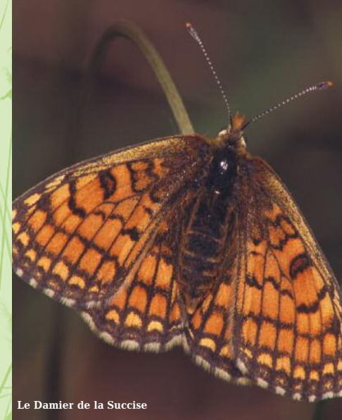
Le Damier de la Succise

Site Natura 2000 Espace Naturel Sensible (E.N.S.) - Voir p. 62